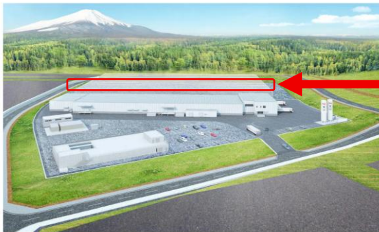
富士山麓第二工場 イメージ図