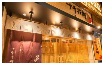
十千花前 清水 (静岡市清水区)