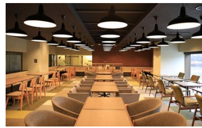
ロダンテラス (静岡市駿河区)