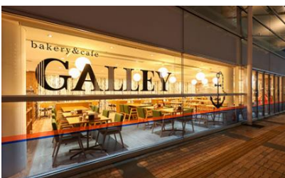
Bakery&Café GALLEY (静岡市駿河区)