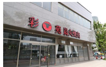
うなぎの佳川 (浜松市中央区) うなぎの佳川 葵(浜松市中央区) 焼肉 Wagyu 彩苑(浜松市中央区)