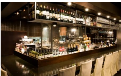
炙之介 (静岡市葵区)