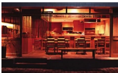
十千花前 静岡 (静岡市駿河区)