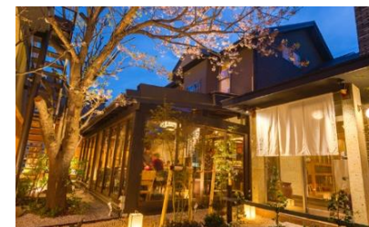
草薙 茄兵衛 (静岡市清水区)