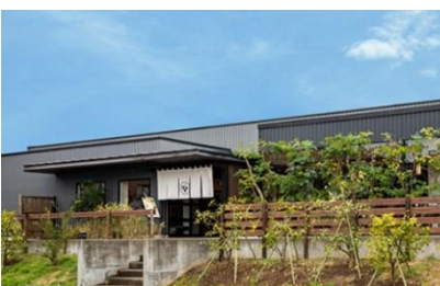
ぶどうの丘 草薙 (静岡市清水区)