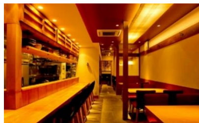
魚弥長久 (静岡市葵区)