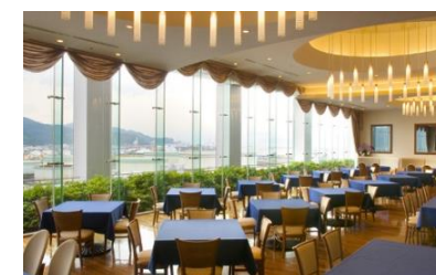
ブランオーシャン(静岡市清水区)