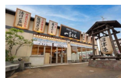
沼津港・海天寿司 一富士丸 (沼津市)