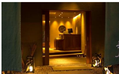
茄子の花 無庵 (静岡市葵区)

■(株)なすび (店舗一覧 https://www.nasubi-ltd.co.jp/storelist/ )