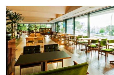
ロゼテラス (富士市)