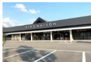
燈乃 maison 有玉店(浜松市中央区) 燈乃 maison 豊橋店(豊橋市) 燈乃 maison 藤枝店 (藤枝市)