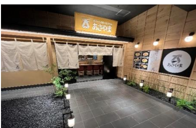
天ぷらと手延べそうめん