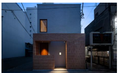
一ふじ二たか (静岡市駿河区)