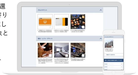
“顧客と株主がつながる”新たな株主優待制度の活用 2022 年版お申込みサイトイメージ

このような考えを両立する施策として 2021 年から、通常なら利益還元に含まれる株主優待制度の枠組みを活用し、当社では事業投資寄りの施策と位置付ける、“顧客と株主がつながる”新たな利用体験を実施しております。2021 年は 167 社、2022 年はコロナ禍に休業要請の対象となった業種の企業 35 社にご賛同いただきました。今後も本企画を通し、株主の皆様には「新たな商品の発見と出会いを楽しんでいただく」、ご利用企業には「自分たちの商品やサービスが新たなユーザーに届く」、ステークホルダー同士がつながる体験を当社のサービス「PR TIMES」上で実現する機会を目指してまいります。